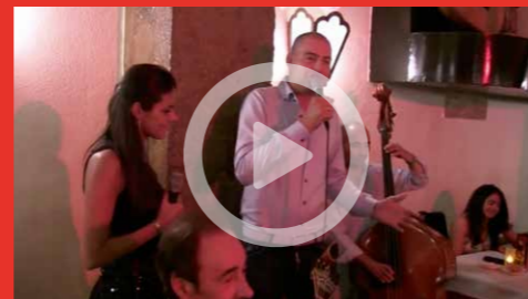
VIDEO: Zing voor me