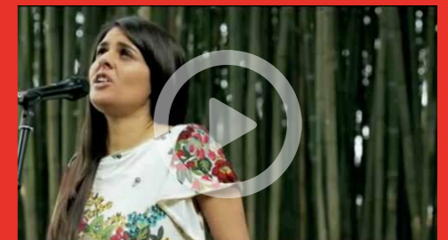
VIDEO: Fado do Contra